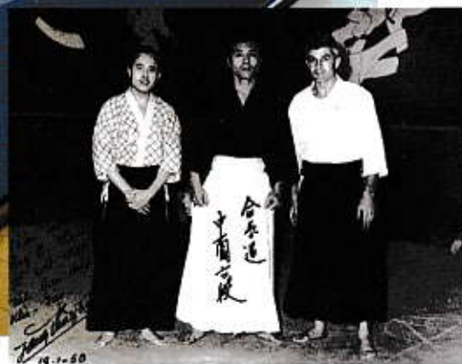
En haut, une vue du dojo actuel. Ci-dessus, Maître Nakazono à Nimes en 1958. Ci-contre à gauche, une photo prise lors du stage des sensei Abbe et Abe en 1959.

qui permet de mener des actions de sensibilisation auprès des droits des femmes ainsi que dans des lieux sociaux et médico-sociaux à la demande. Pour la saison prochaine, un projet est en cours afin d'offrir aux enfants des cours d'Aïkido gratuits dans le cadre de la journée des droits des enfants.